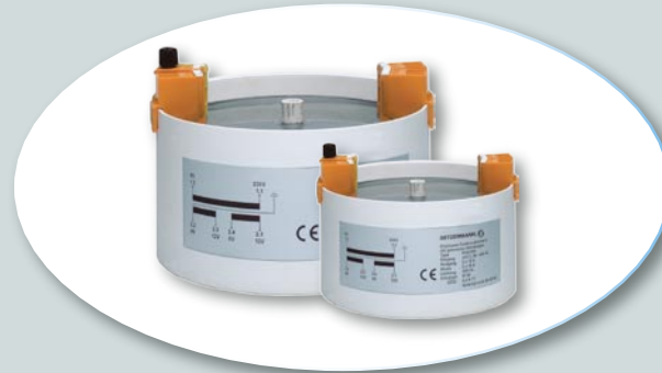
Reihe RSK Ringkern - Festtransformatoren Vergossen, mit Anschlußklemmen. Max. 2,5 kVA

Série RFT Transformateurs toroïdaux Nus, avec fils libres. Max. 8 kVA