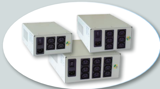
Reihe REOMED Medizinische Trenntransformatoren Nach DIN EN 60601-1. Max. 1000 VA

Série RFT/HS Transformateurs à haute intensité Max. 5 kA