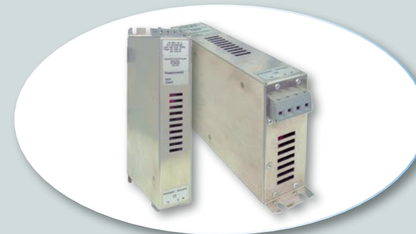
Reihe DCV Gleichstrom - Versorgungen Einbaufertig, störungsarm. Max. 600 W

Série RFT/DV Transformateurs triphases Prêt à montage. Avec cornières de fixation. Max. 3 x 1,2 kVA