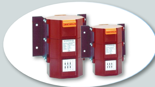
Reihe RFT/DV Drehstrom - Transformatoren Einbaufertig, mit Montagewinkel. Max. 3 x 1,2 kVA

Série REOMED Transformateurs d'isolation pour médecine Selon DIN EN 60601-1. Max. 1000 VA