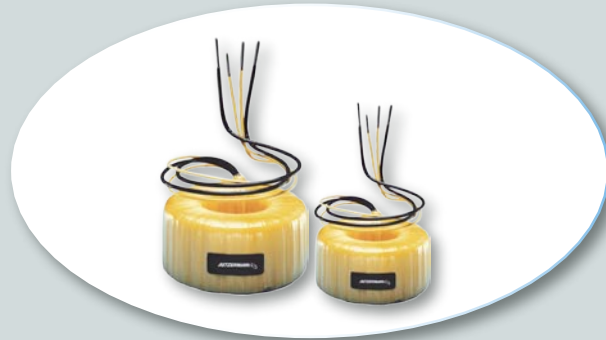
Reihe RFT Ringkern - Festtransformatoren Offen, freie Anschlüsse. Max. 8 kVA

Series RFT Toroidal fixed transformers Open, flying leads. Max. 8 kVA