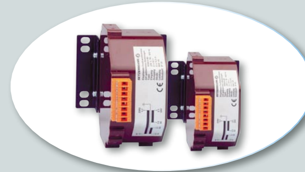
Reihe RFT/V Ringkern - Festtransformatoren Einbaufertig, mit Montagewinkel. Max. 1,2 kVA

Série RSK Transformateurs toroïdal Entièrement compoundés, avec barette à bornes. Max. 2,5 kVA